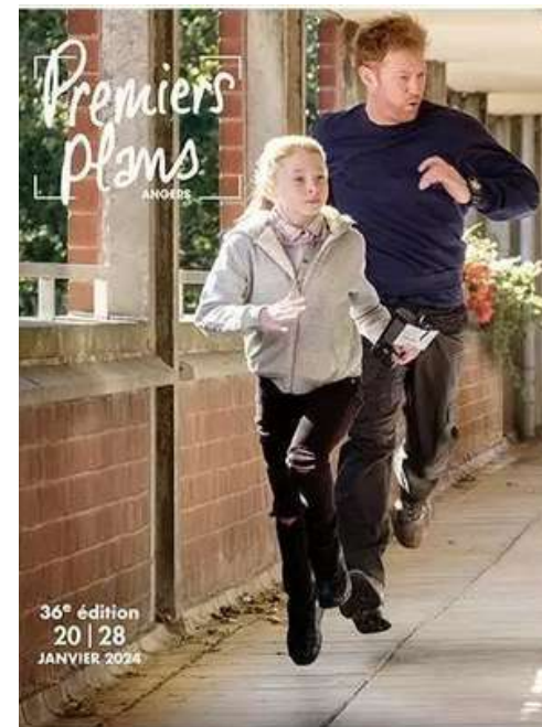
affiche du festival Premiers Plans 2024